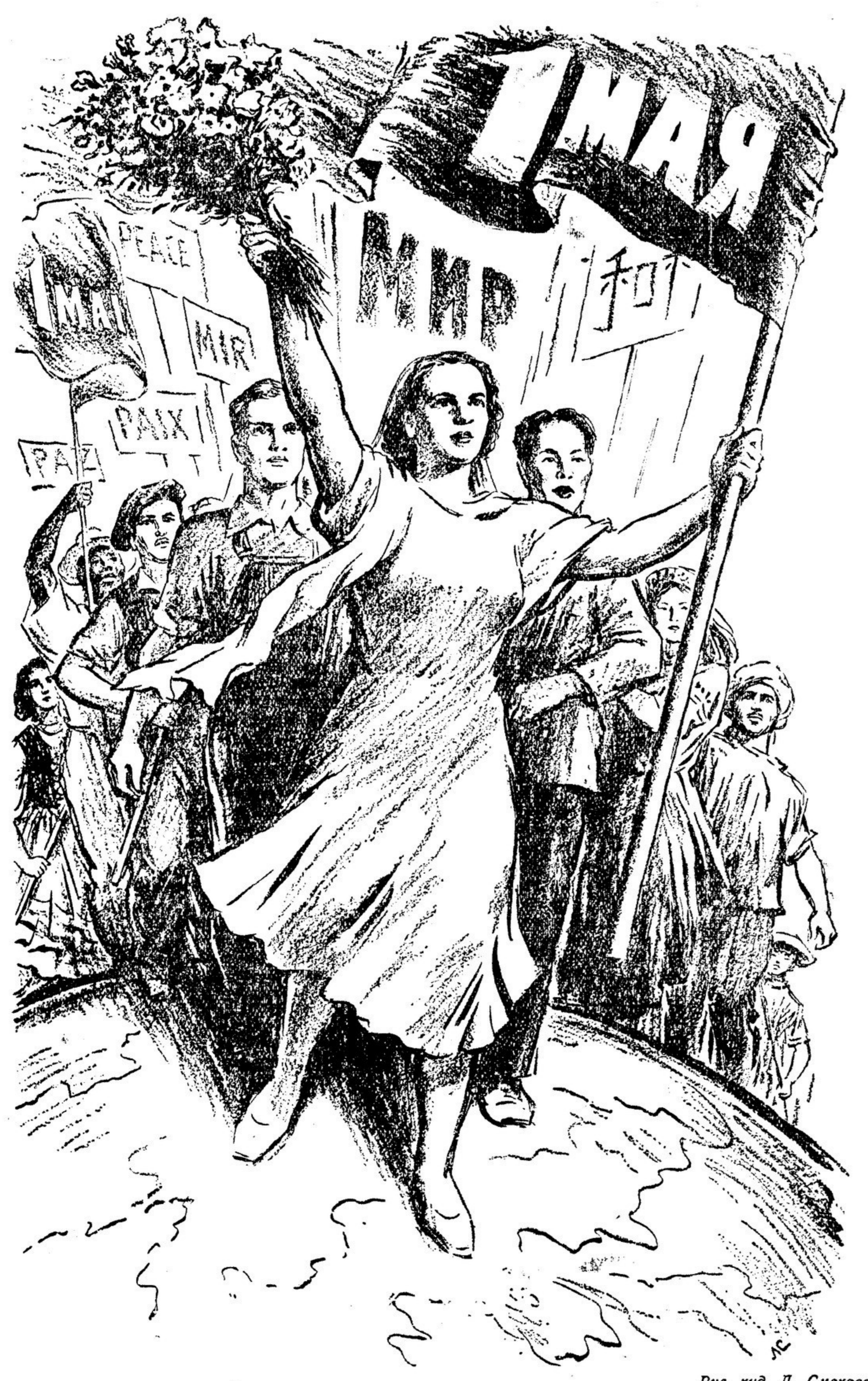
Рис. худ. Л. Смехова